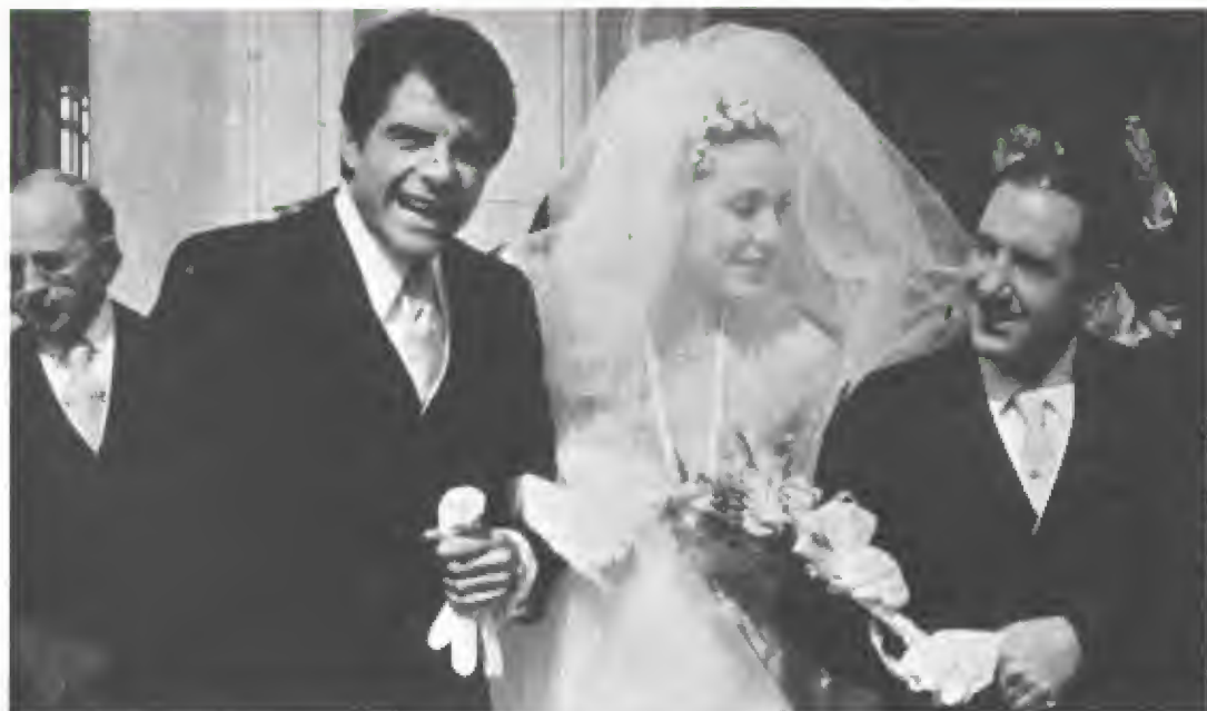
Juan Luis Galiardo - Norma Duval - Alfredo Landa